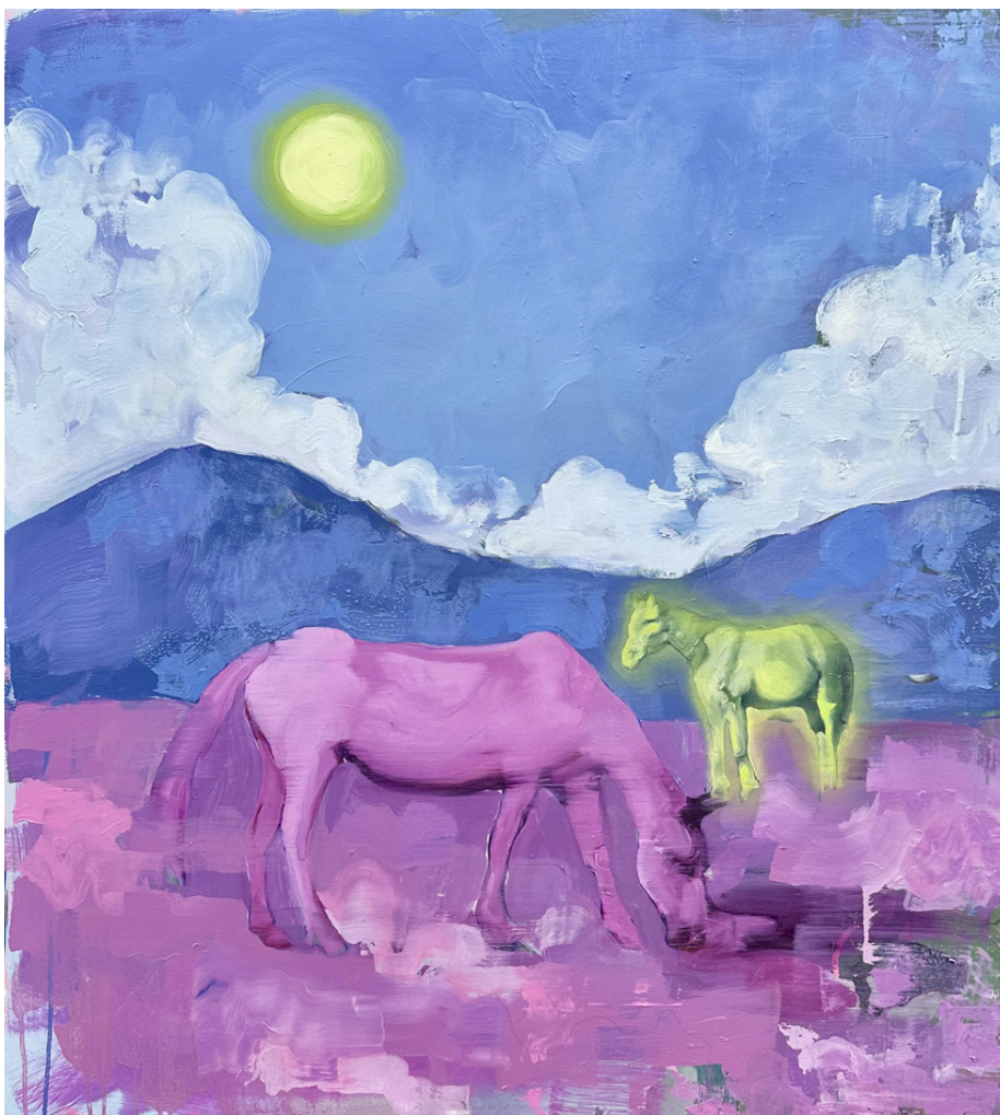
Amico immaginario Olio su tela, 80x100 cm, 2026