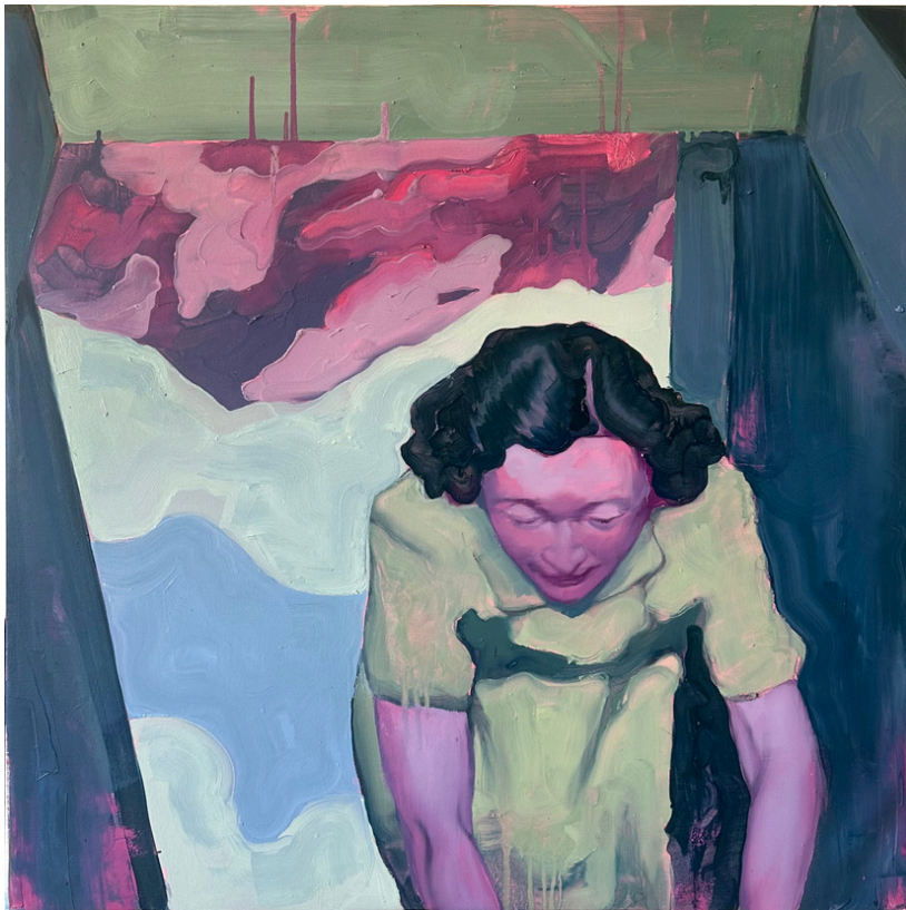
Laggiù in paradiso Olio su tela, 75x75 cm, 2024