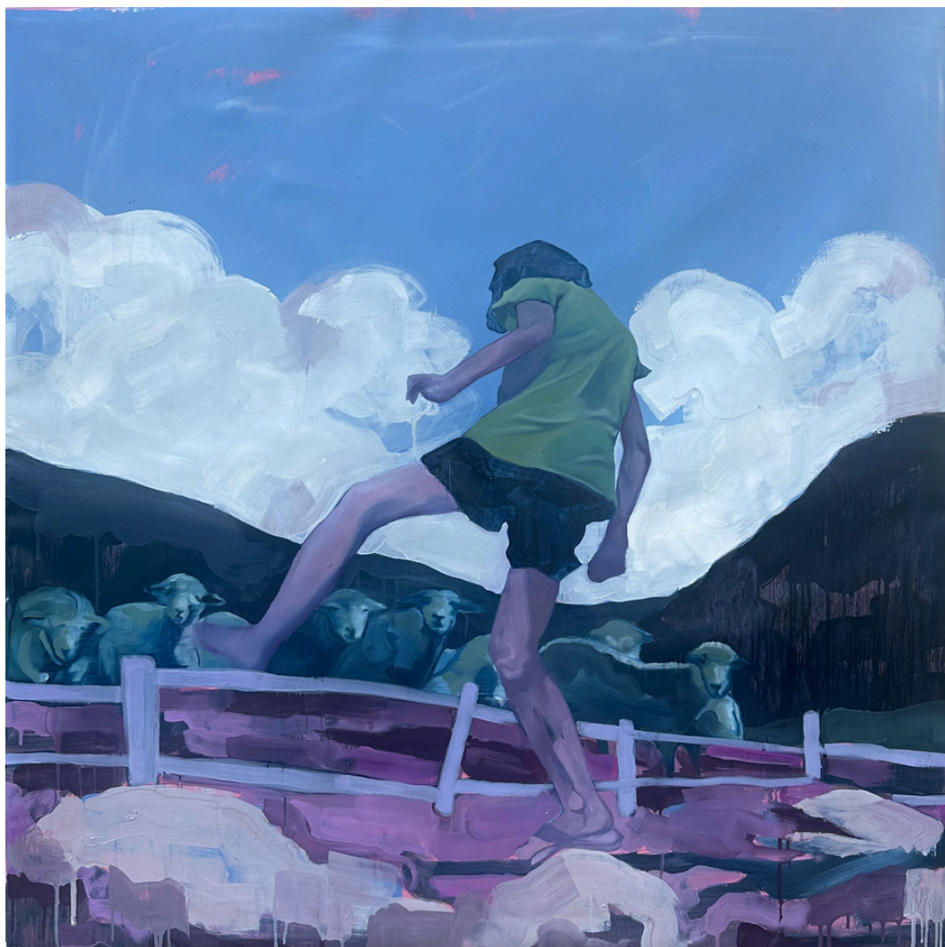
Tra l'impervio e il domestico Olio su tela, 120x120 cm, 2024